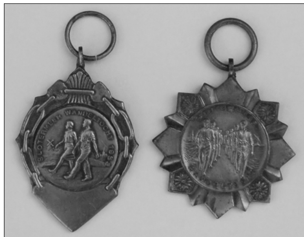
Twee verschillende uitvoeringen van de medaille. Op de linker medaille staat voorop het jaartal 1953. Op de rechter medaille staat op de achterkant 12-7-'52 vermeld.