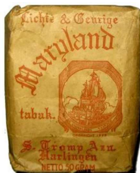
50 gram 70 ct

Na de vrede in 1918 zakten de prijzen weliswaar, maar daalden nooit meer naar de vooroorlogse prijs. Tijdens de tweede wereldoorlog ontstond juist een gebrek aan tabak met als dieptepunt 1944. Maar ook de verandering van het tabaksverbruik na 1945 had zijn invloed op de bedrijfsvoering. De sigaret werd favoriet en naar de shagtabak van kleine fabrieken werd steeds minder gevraagd, ondanks de stabilisatie door de pruimtabak. Langzamerhand, o.a. door accijnsverhogingen, werd de rooktabak te duur en het economisch klimaat voor de kleine fabriek daalde sterk.