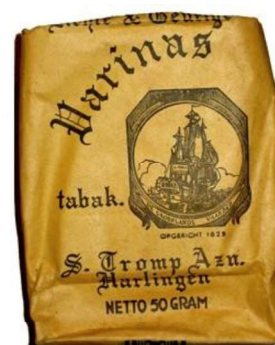
50 gram 80 ct